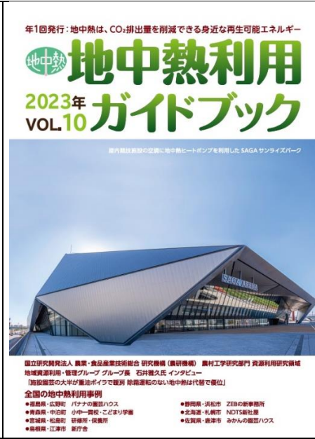
地中熱利用ガイドブック 2022年 Vol.10 B5版 52ページ