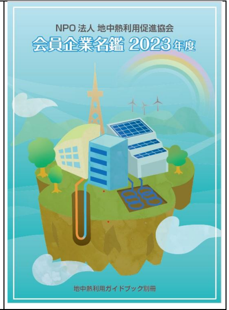
地中熱利用ガイドブック別冊 会員企業名鑑 2023 B5版 68ページ