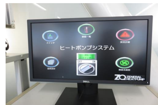
[システム監視・制御モニター]